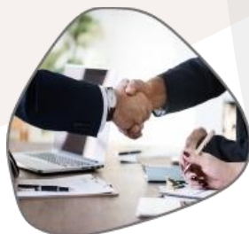
INNOVACIÓN SOCIAL FOMENTAMOS LA CREATIVIDAD