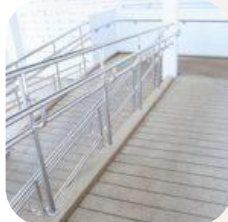
29/03/2019. ¿Aprueban las viviendas en accesibilidad universal? Revista CIC Arquitectura y Sostenibilidad