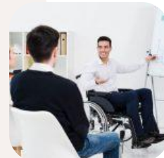
26/08/2019. ¿Cómo facilitar una Accesibilidad Universal?