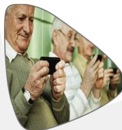
TECNOLOGÍA AL ALCANCE DE NUESTROS PROGRAMAS