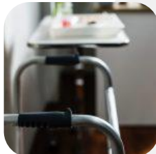
12/08/2019. Adaptar la vivienda para personas con discapacidad