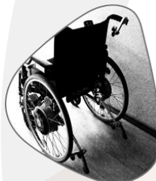
IMPLICACIÓN VAMOS MÁS ALLÁ DEL COMPROMISO