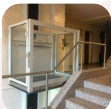
09/12/2019. Elevadores salvaescaleras: la tecnología al servicio de las personas con movilidad reducida-