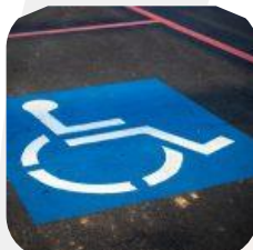
16/09/2019. ¿Qué es el baremo de movilidad reducida?