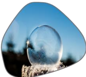
TRANSPARENCIA PARA LA SOCIEDAD