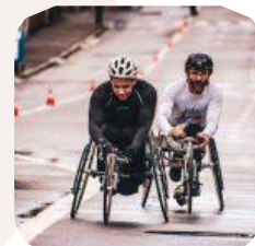
20/09/2019. Las ayudas técnicas para las personas con movilidad reducida